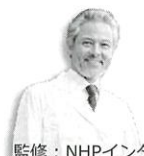
監修：NHPインターナショナル認定機構