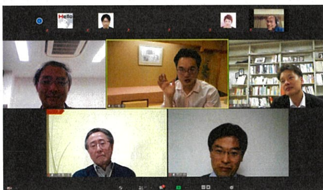
(パネルディスカッション)

第3回目となった2020年度の「医療経済短期集中コース」は、2020年11月20日(金)、21日(土)、22日(日)、28日(土)、29日(日)の日程でオンラインにて行われました。医師・看護師を含む医療従事者、病院事務部門、地方自治体、製薬企業などから、27名の方が第三期生として受講されました。